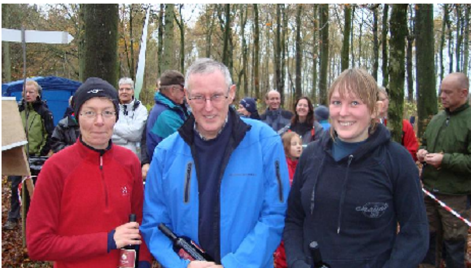
Gruppe D—et vinderhold i Efterårsstafetten