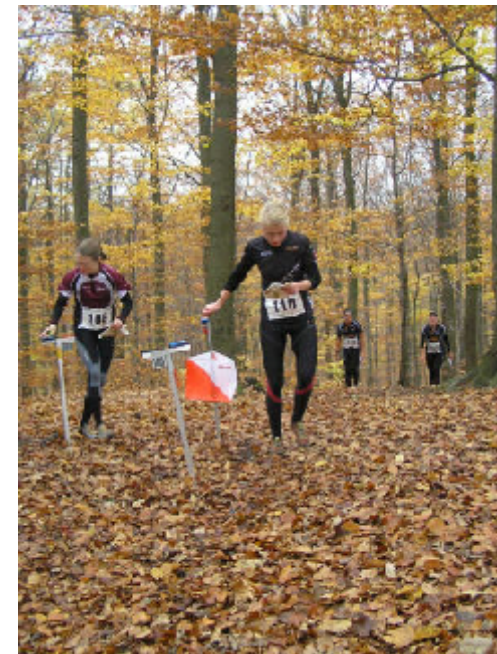
Fra Jættemilen 2009