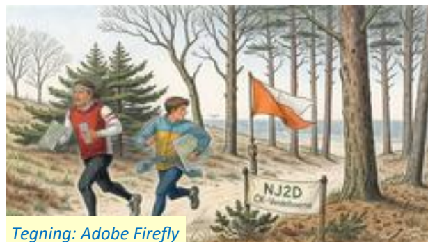
Tegning: Adobe Firefly

Den 18. marts var der eftersnak om stævnet med deltagelse af en række af funktionslederne.