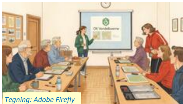
Tegning: Adobe Firefly

Nordjysk 2-dages, dette års flagskib var, havde jeg nær